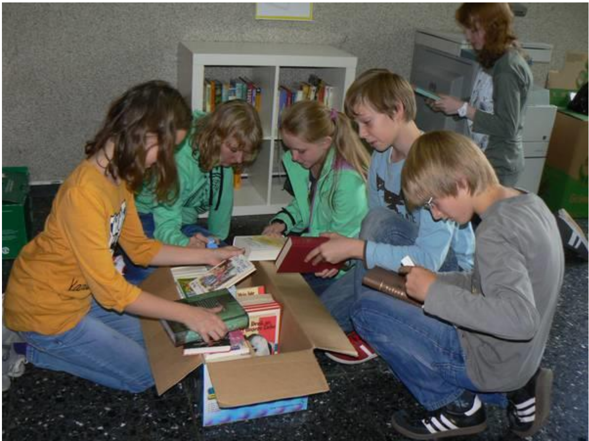
Die Lesescouts beim Einräumen des „Tausch-mich-Regals“