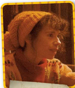
MRS. BROWN MUTTER