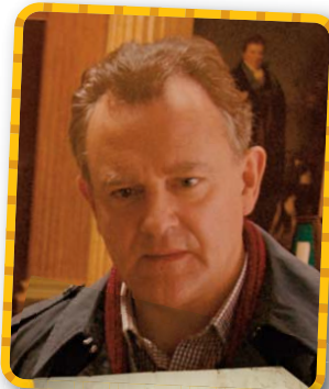
MR. BROWN VATER

Paddington ist in Peru aufgewachsen. Dort hat ihn seine Tante Lucy im Dschungel aufgezogen. Nach einem Erdbeben schmuggelt sie Paddington an Bord eines Schiffs. Das bringt ihn nach England. Dort nimmt ihn zum Glück Familie Brown bei sich auf. Allerdings stellt Paddingtons Tollpatschigkeit sie manchmal vor große Herausforderungen.