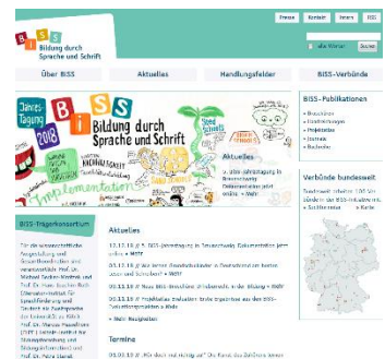
©Homepage-Startseite von BiSS.